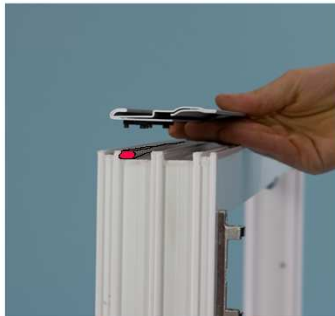
Dichtband einlegen Verstärkungseisen positionieren