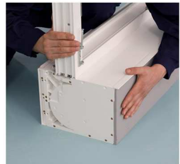
Blendrahmen mit Adapter in Basisprofil einrasten