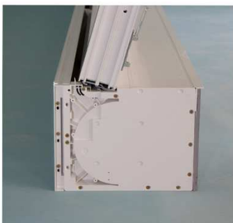
Blendrahmen mit Adapter auf Basisprofil aufsetzen