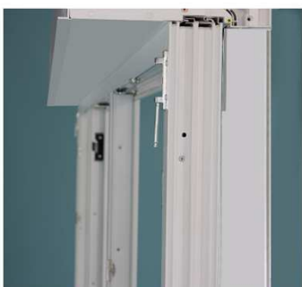
Richtigen Sitz des R-Kasten's überprüfen