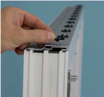
Raster in Spezialverstärkungseisen eindrücken