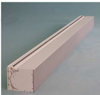
R-Kasten auf Deckelblende legen